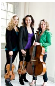
Lendvai String Trio