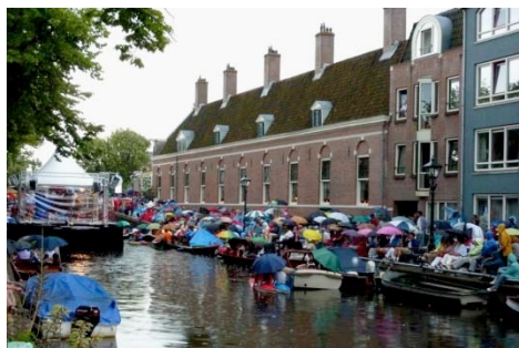
"Sitting in the rain"

Hierbij willen we u informeren over de komende Lindegrachtconcerten. Ze vinden plaats op de dinsdagen 12 en 26 juli en 9 augustus , steeds om half negen 's avonds.