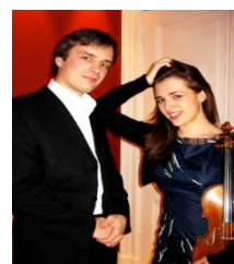
Vital en Ksenia

Het Lindegrachtseizoen 2011 wordt afgesloten met een optreden van het J.O.N.G.ensemble . Acht jonge musici bespelen acht verschillende blaasinstrumenten, begeleid door contrabas en slagwerk. Met hun gevarieerde programma “Ratatouille” zorgen ze ongetwijfeld voor een enthousiast en meeslepend einde van onze concertserie.